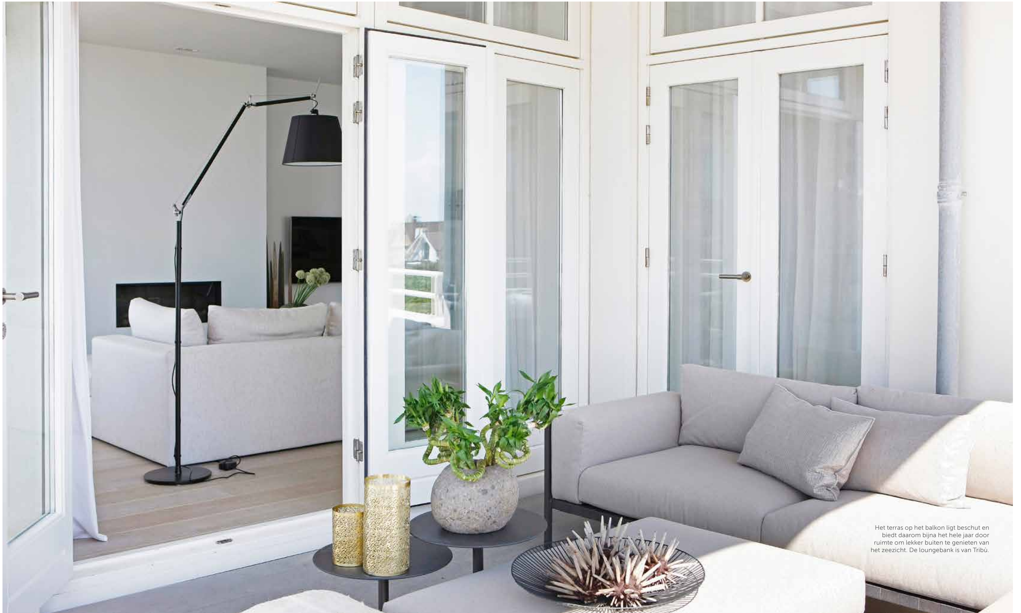
Het terras op het balkon ligt beschermd en biedt daarom bijna het hele jaar door ruimte om lekker buiten te genieten van het zeezicht. De loungebank is van Tribù.