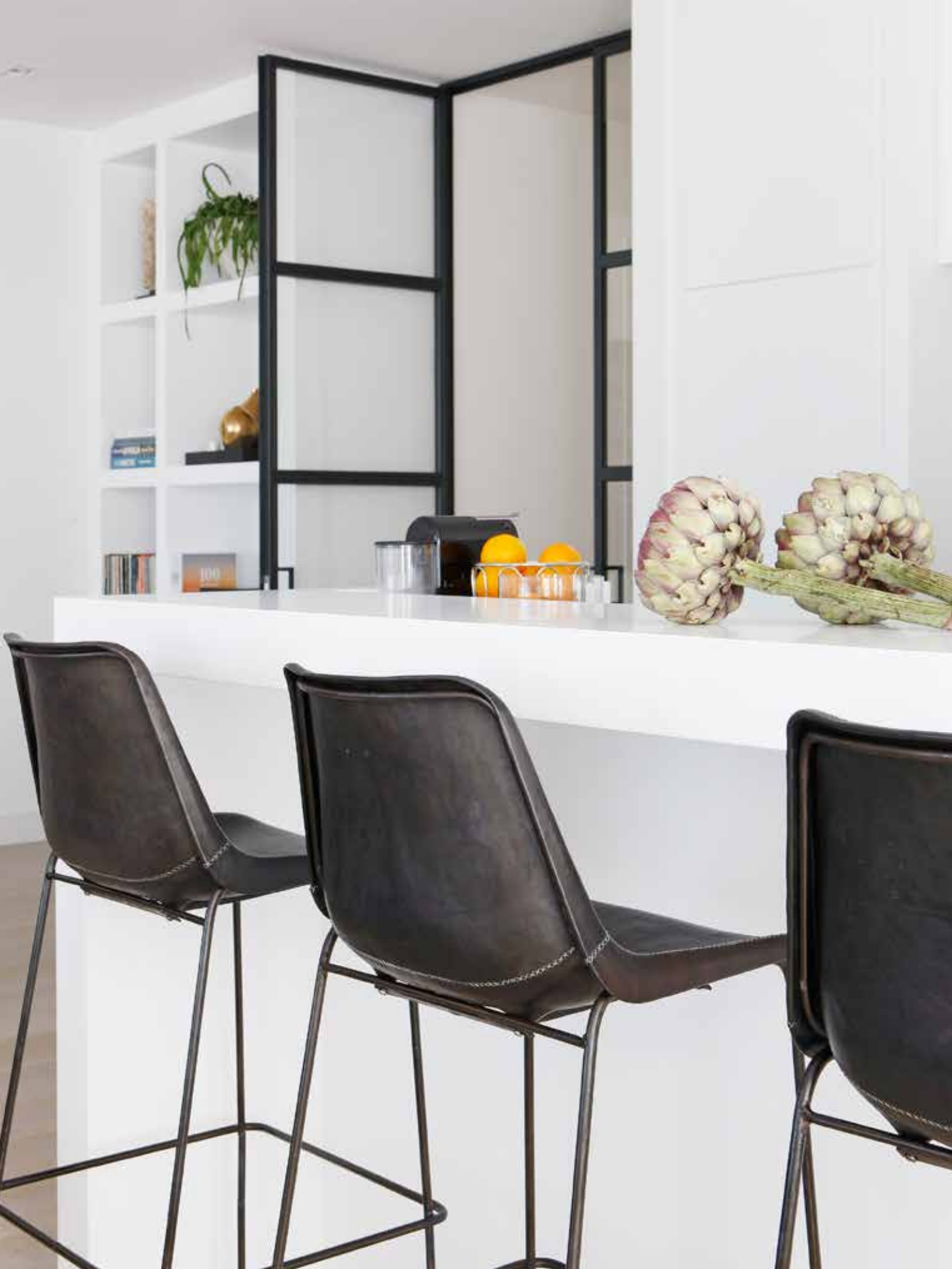
De zijdematte keuken met Miele apparatuur is op maat gemaakt via de interieurbouwer van Raw Interiors. Het aanrecht is van roestvrijstaal. Aan de bar staan krukken met een leren kuipzitting in een zadelsteek van het Spaanse merk Sol&Luna (via Raw Interiors).